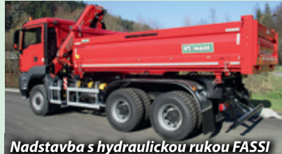
Nadstavba s hydraulickou rukou FASSI