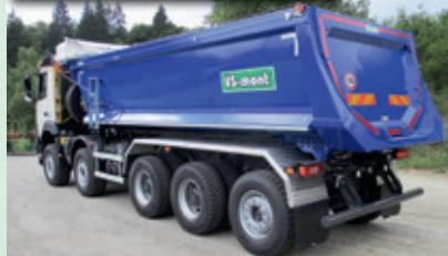
Trojstranná nadstavba S3