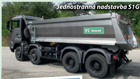
Jednostranná nadstavba S1G